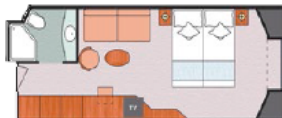
Ocean view Classic (EC) 17.7 sq m (190.52 sq ft) 1 double bed or 2 single beds 1 foldaway bed window