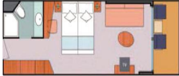
Balcony Classic (BC) 20.4 sq m (219.58 sq ft) 1 double bed or 2 single beds 1 foldaway bed 1 sofa bed