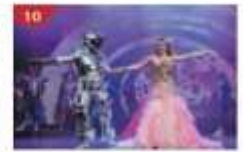
Zodiac Theatre Enjoy live production shows from the acclaimed award-winning entertainment team.

เย็น รับประทานอาหารเย็น ณ ห้องอาหารหลัก จากที่โชว์อยู่บนบัตร Cruise Card ของท่าน หรือเลือก รับประทานที่ห้องอาหาร บุฟเฟต์ นานาชาติ ได้ตามอัธยาศัย หลังจากนั้นชมการแสดงที่ห้องโชว์ หลัก (ท่านที่จะชมโชว์จะต้องทำการจองรอบโต๊ะที่Box Office ซึ่งตั้งอยู่โซน Lobby ชั้น 6) และดนตรีสดตามบาร์ต่างๆทั่วทั้งลำเรือ และพักผ่อนตามอัธยาศัย