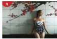
Crystal Life™ Spa Rejuvenate mind, body and soul with our holistic Western and Asian spa experience.