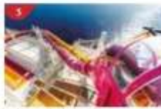
Waterslide Park Get drenched in fun on one of our six different waterslides.