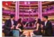
Bar 360 Catch live music and aerial acrobatic performances with a glass of champagne.