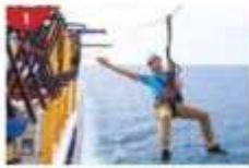
Ropes Course & Zipline Feel the thrill of gliding above the ocean on a 35-metre zipline.