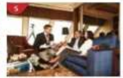
The Palace Indulge in European-style butler service and exclusive facilities.