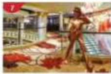
Johnnie Walker House™ Immerse yourself in the intricate world of premium Scotch whisky.