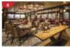
Bistro By Mark Best Relish contemporary Western cuisine from the internationally-acclaimed Australian chef.