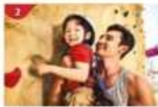
Rock Climbing Wall Challenge yourself on our mountainous rock climbing wall.